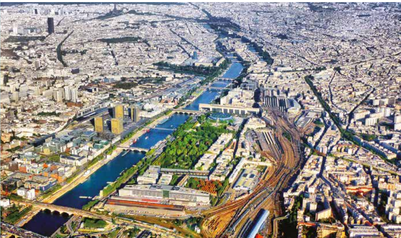
Aerial view of Paris, France