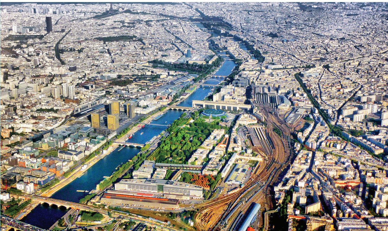
Párizs madártávlatból, Franciaország