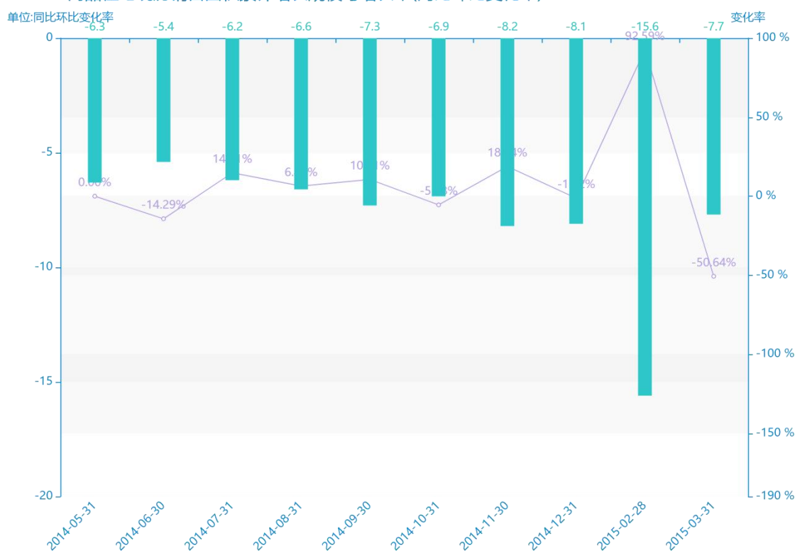
2014-2015商品住宅现房销售面积累计增长规模与增长率(同比环比变化率) ■ 商品住宅现房销售面积累计增长(%) —○— 增长率