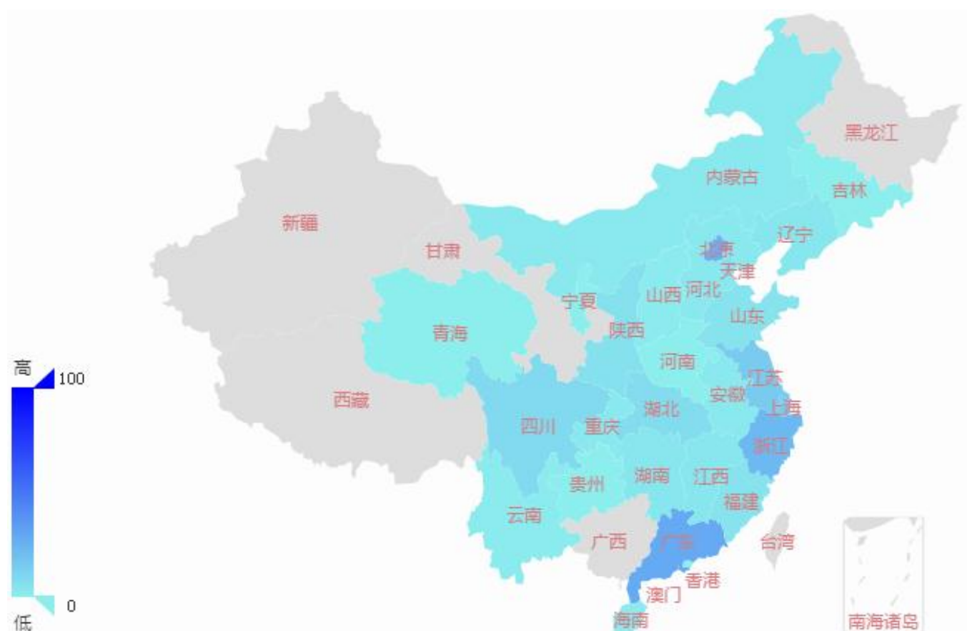
图 2 并购案例数量地域分布 (按标的方)