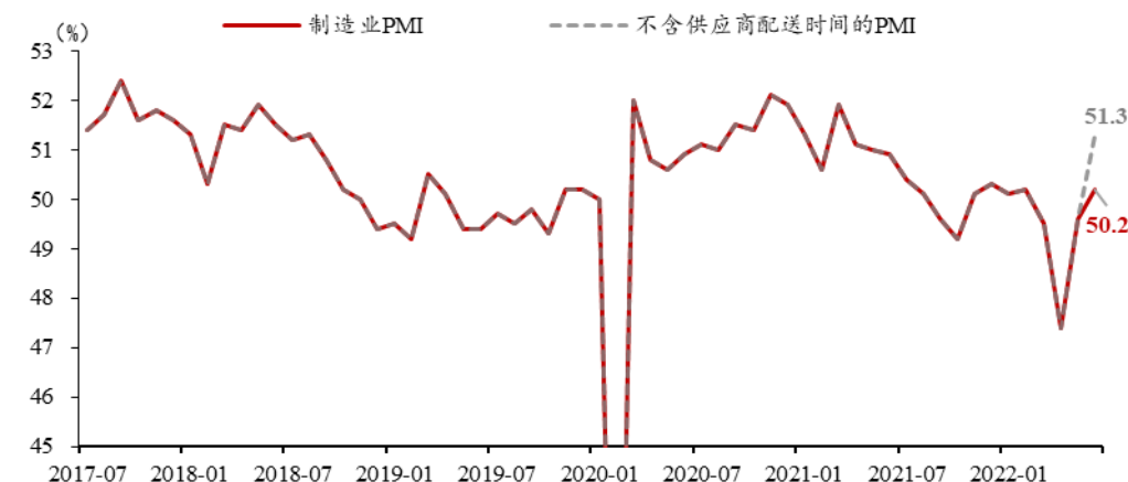
图 1: 供应商配送时间拖累 PMI 读数