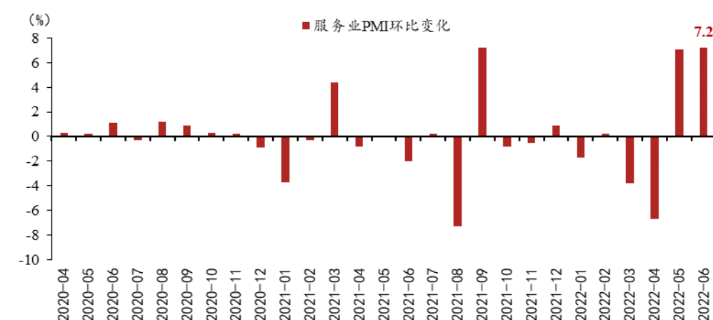
图 2: 服务业大幅改善