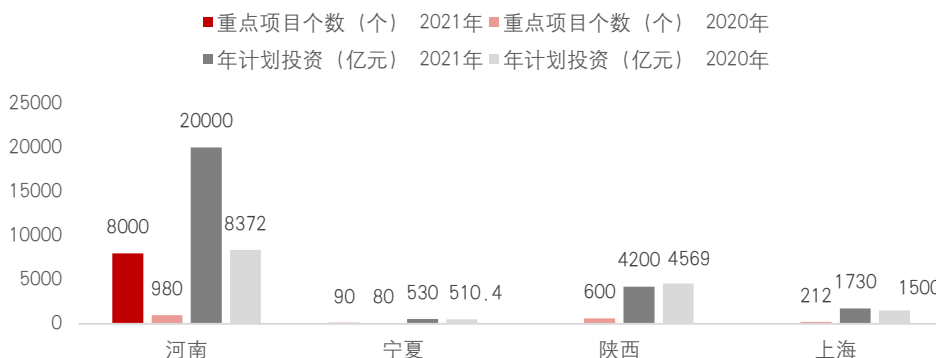
图2：2021年与2020年重点项目和投资额对比

大部分省市的《政府工作报告》提出要加快数字经济、工业互联网、数据中心等领域的建设，11个省市提出了5G基站的建设目标。从步调上来看，目前发达省市的建设速度显著快于欠发达地区，而较慢的省市将在2021年着重发力。截至2020年8月底，北京市累计开通5G基站4.4万个，而2021年新增目标为6000个；云南省在2020年同期建成5G基站1.8万座，2021年计划累计拥有5G基站5万座。